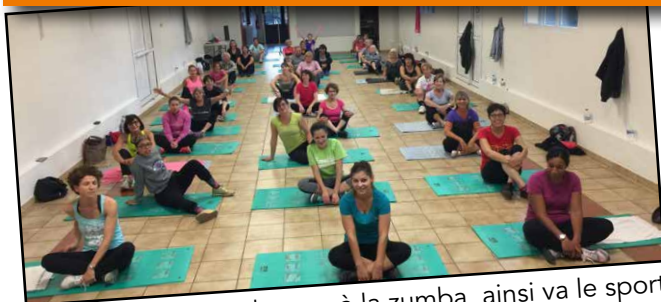
De la gym à la zumba, ainsi va le sport à Rouilly-Saint-Loup et Montaulin