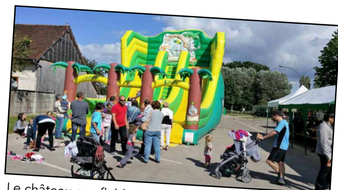
Le château gonflable très apprécié des enfants