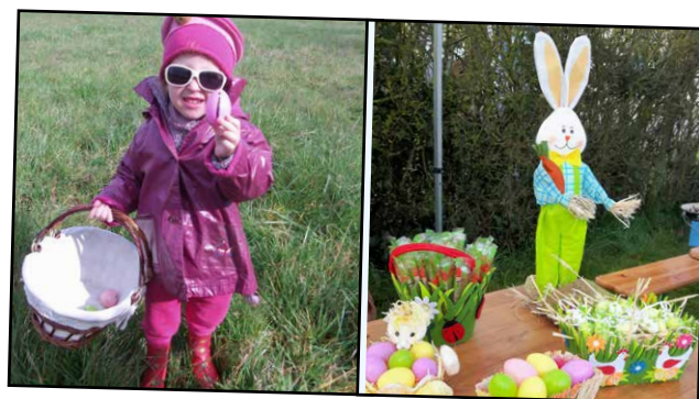
Beau succès pour la 1 re chasse aux œufs