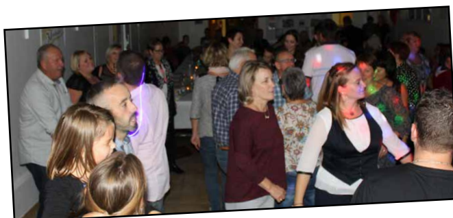
Soirée tartiflette, une belle réussite