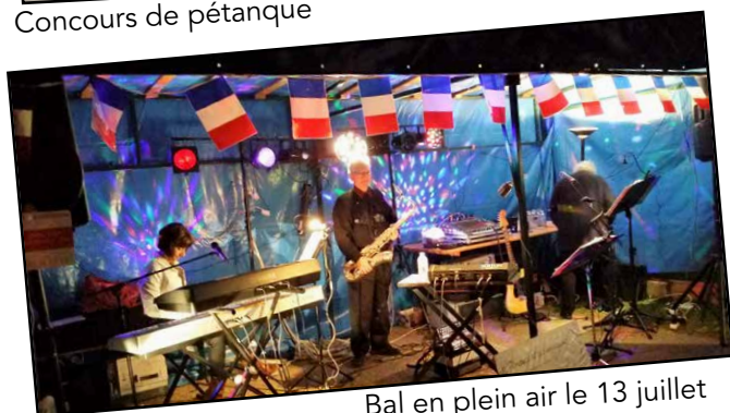
Bal en plein air le 13 juillet