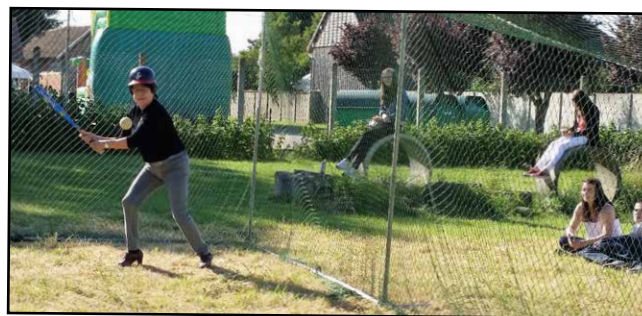
Initiation au Baseball encadrée par le Club des Espadons le 14 Juillet.