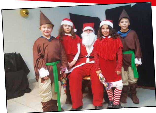
Le Père Noël et ses lutins