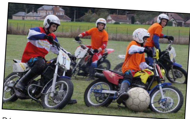
Démonstration des juniors du SUMA Motoball