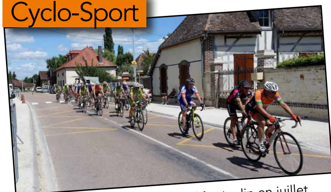
Course pour le Grand-Prix de Montaulin en juillet