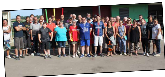
Concours de pétanque