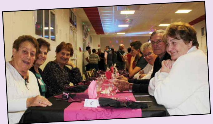
Soirée dansante, une belle réussite