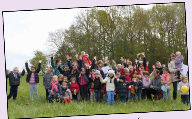
Belle récolte lors de la chasse aux œufs