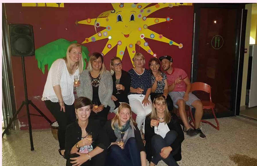
L'équipe du SIVOS enchantée

Depuis le mois de septembre, l'accueil de loisirs ouvre ses portes toute la journée le mercredi suite à la suppression des NAP (Nouvelles Activités Périscolaires). C'est pour cela que la ludothèque : « la Trot-tinette » intervient tous les 15 jours pendant 2 heures.