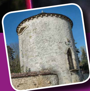
La tour du château