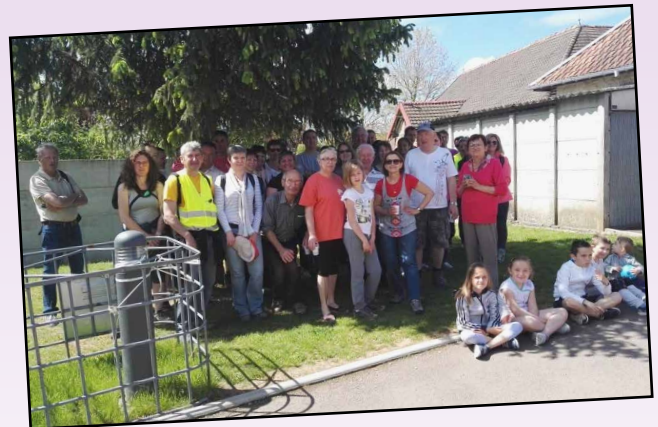
Photo souvenir de la randonnée