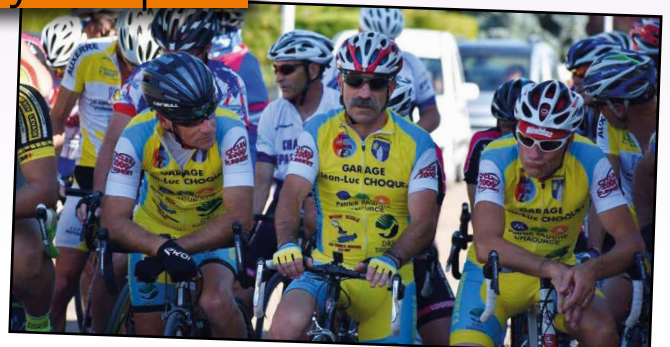
Course pour le Prix de Montaulin en juillet