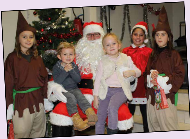
Le Père Noël et ses lutins