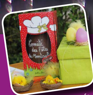
La chasse aux œufs