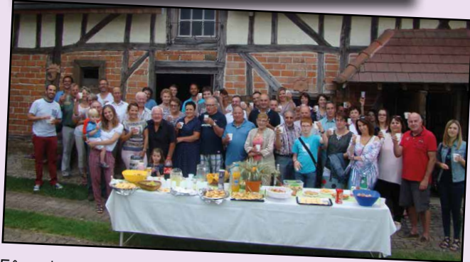
Fête des voisins, rue du Château