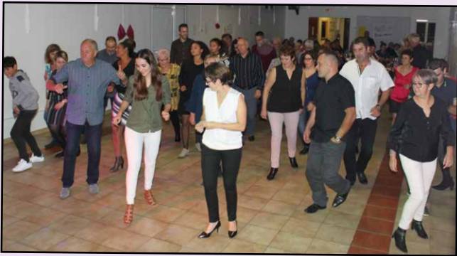
Soirée dansante, le bal est ouvert