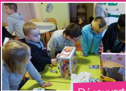
Découverte des jouets