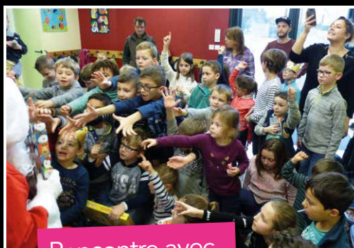
Rencontre avec le Père Noël