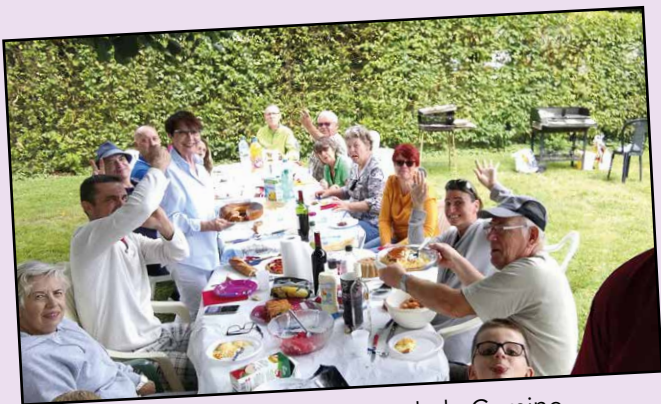
Fête des voisins au Lotissement de la Cumine