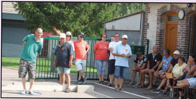
Concours de pétanque, la finale