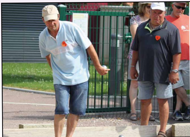
Concours de pétanque