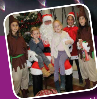
La venue du Père Noël