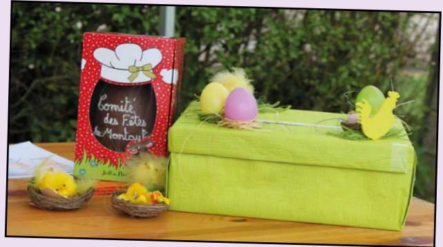
Beau succès pour la 2 e chasse aux œufs