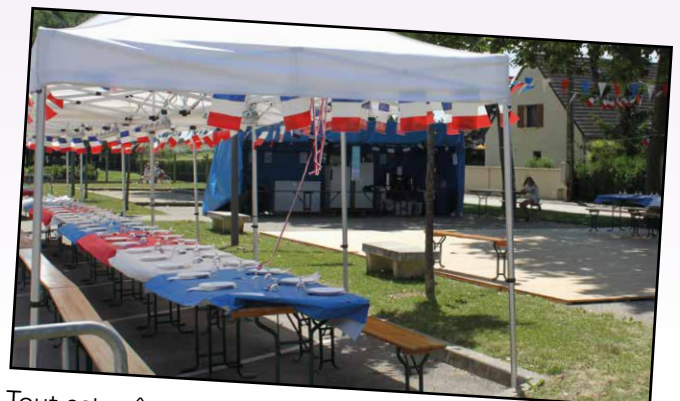
Tout est prêt pour accueillir les habitants pour le repas du 14 Juillet