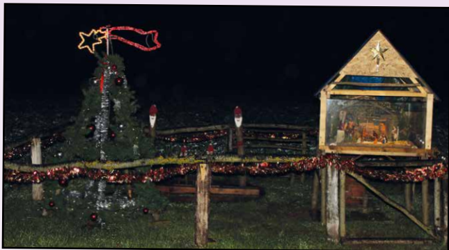
Au hasard d'une rue, un joli décor de Noël réalisé par un habitant